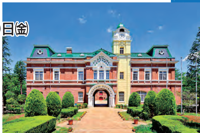
日本遺産「牛久シャトー」

今回の取り組みは、コロナ禍において市内の飲食業、観光事業者等が大きな影響を受けている中、牛久市内でのGoToトラベルを実施し、改めて牛久の魅力を再発見してもらおうとともに、今後の観光客誘致につなげることによる市内事業者の事業継続支援を目的とし、牛久市、牛久市観光協会、牛久市商工会、及び市内の事業者が連携し実施するものです。